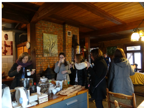
„Dom nad Wierzbami”