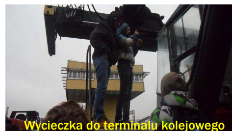
Wycieczka do terminalu kolejowego