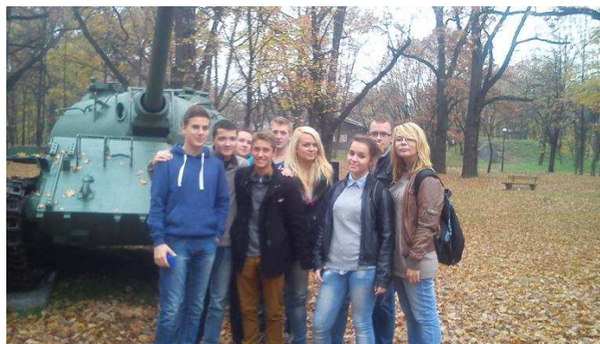
W Akademii Obrony Narodowej w Rembertowie