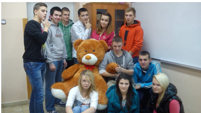
Lekcja z obsługi podróżnych w portach i terminalach