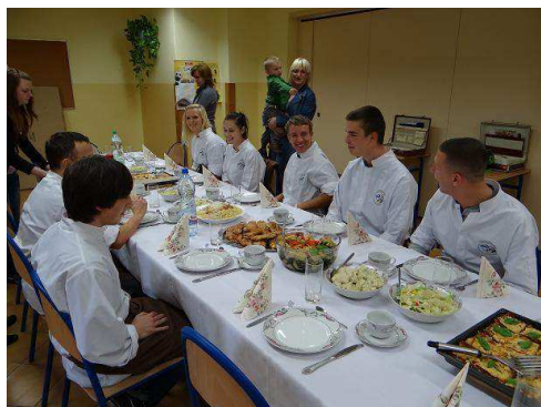
Warsztaty - Kuchnie świata