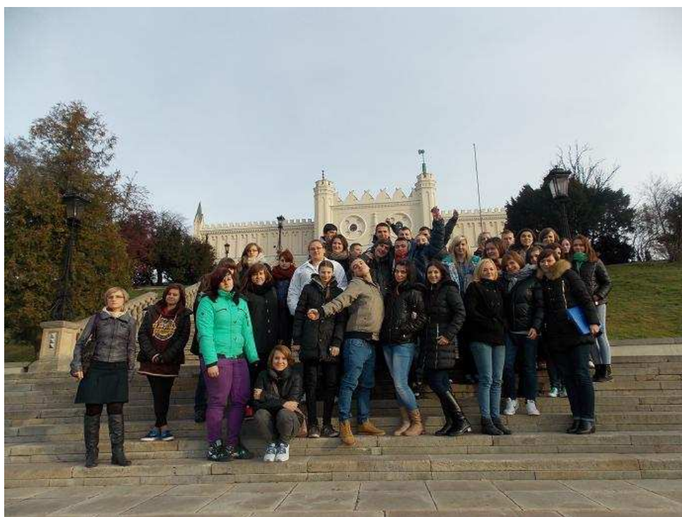
Wyjazd studyjny do Lublina