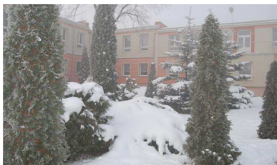
Szkoła w zimowej szacie

Opiekun biuletynu: Ewa Kania-Nec skład i łamanie tekstu: Lesław Koziań