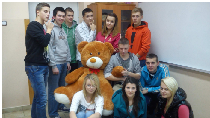
Miś z uczniami klasy II TEPiT

Ćwiczenia możemy realizować przy pomocy różnych rekwizytów, są to m.in.: Manekiny, misie, ubrania itp..