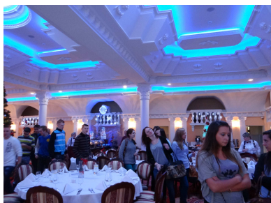
Uczniowie klasy III TŻ-TH

W grudniu 2013 roku klasa III Technikum Hotelarstwa i Technikum Żywności odwiedziła trzy różne obiekty turystyczne. Wyjazdy były częścią międzynarodowego projektu współpracy, w którym udział biorą Lokalne Grupy Działania z Polski i Finlandii.