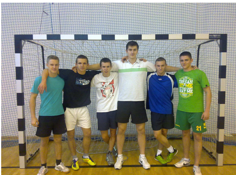
Mistrzowie szczypiorniaka – drużyna klasy IV Technikum Logistycznego

Tel.: 227827101 Faks: 227827498 E-mail: sekretariat@wolski-serock.edu.pl