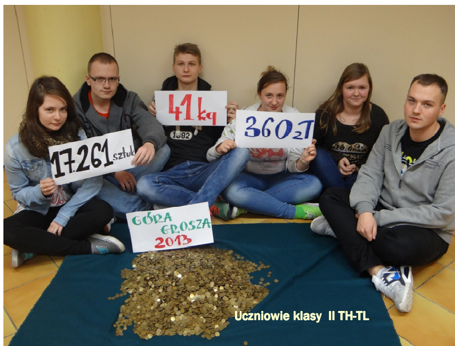
Uczniowie klasy II TH-TL