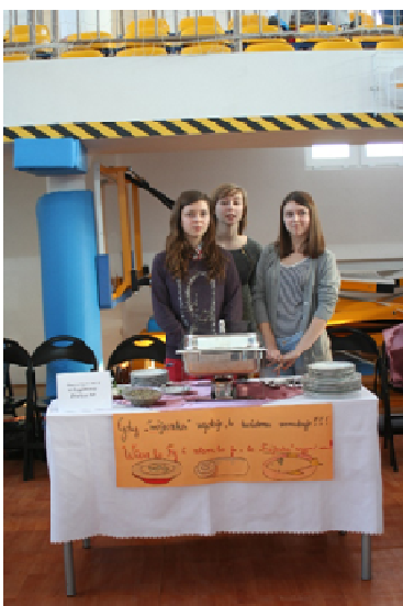
Gimnazjum nr 3 w Legionowie, drużyna 3/ nr 3

Okazuje się, że gotowanie może integrować środowiska i pokolenia. Przykładem jest nasz konkurs, w którego przygotowanie zaangażowali się nauczyciele, uczniowie i pracownicy obsługi.