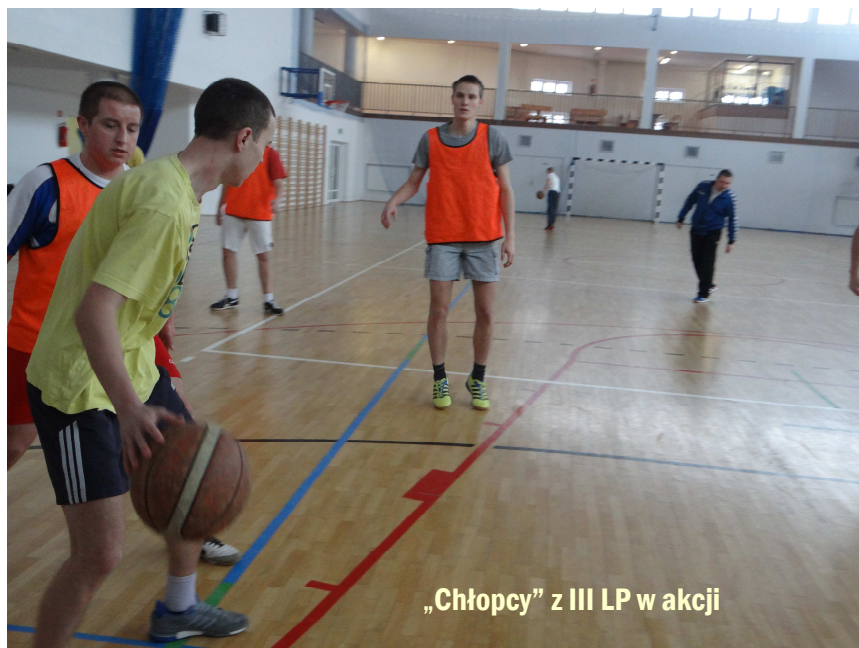
„Chłopcy” z III LP w akcji