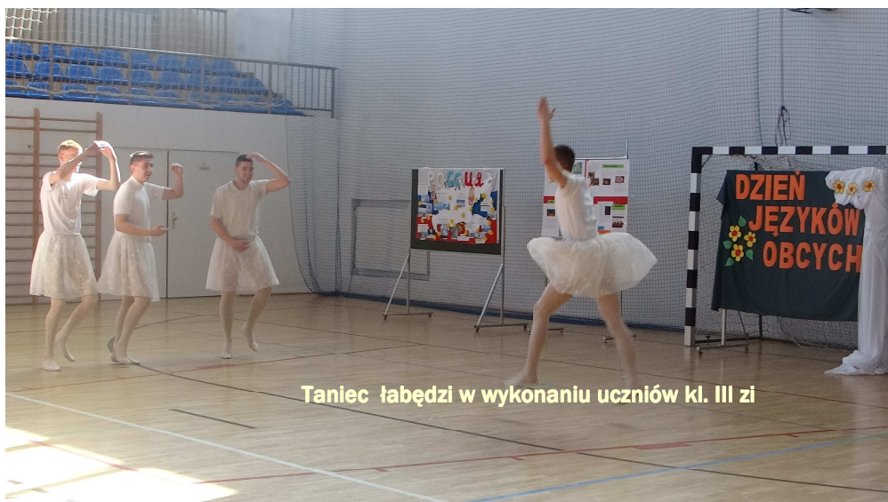
Taniec łabędzi w wykonaniu uczniów kl. III zi

Jednak tegoroczny Dzień Wiosny w naszej szkole był zupełnie inny. „Dzień Języków Obcych” - to brzmi dumnie. Jednak nie wszyscy wyrażali aprobatę dla tego pomysłu, no bo po co przygotowywać coś nowego, skoro wszyscy chcą odpocząć chociaż ten jeden dzień. I chyba nikt nie przypuszczał, że ten dzień