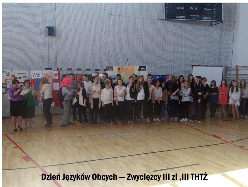
Dzień Języków Obcych – Zwycięzcy III z i ,III THTŻ