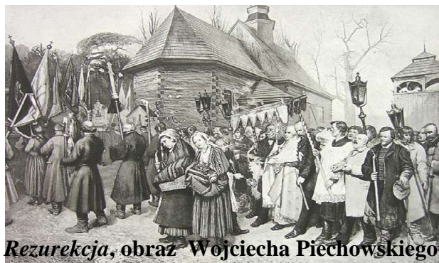
Rezurekcja, obraz Wojciecha Piechowskiego

Msza odprowadzana o świcie w Niedzielę Wielkanocną dla uczczenia Zmartwychwstania Chrystusa to radosny obrzęd, powszechny w krajach słowiańskich.