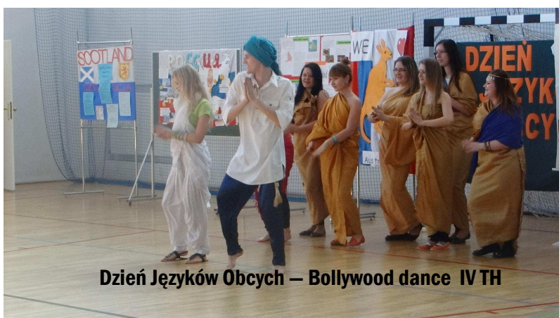
Dzień Języków Obcych – Bollywood dance IV TH