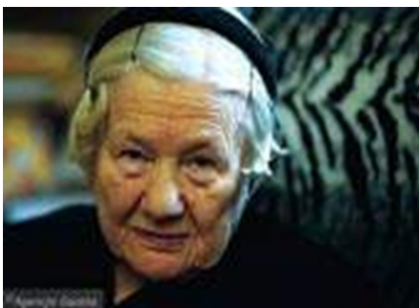
Irena Sendlerowa (1910 - 2008)

Prosimy Was o włączenie się w akcję „Płomień Pamięci” i postawienie w oknie 27 stycznia o godz. 18.00 zapalanej świecy, która ma być symbolem płonącej w nas pamięci o osobach, które musiały przejść przez to piekło.