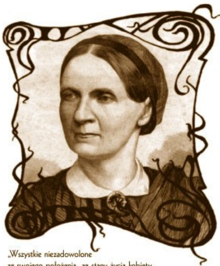
„Wszystkie niezadowolone ze swojego położenia, ze stanu życia kobiety, czyli tak zwane emancypantki, w tę samą rubrykę wpisano, nieprzyjaciółkami moralności ogłoszono i za wyjęte spod szacunku publicznego uznano.” Narcyza Żmichowska