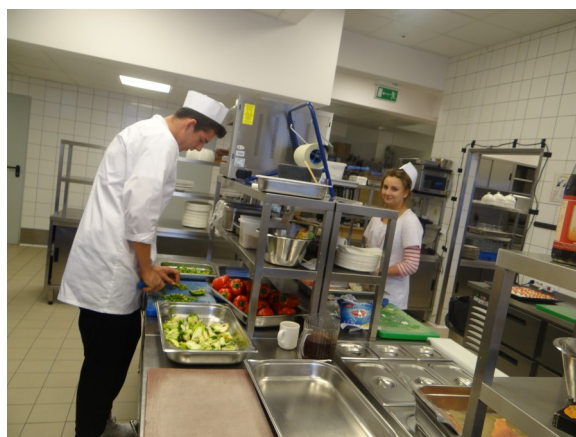
Autorzy na miejscu praktyk - kuchnia hotelu Narvil